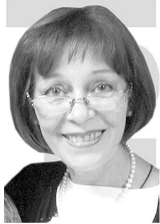
Художественный руководитель Общественного Центра поселка Семрино.

Скаждым годом их становится все меньше и меньше, а денег выбрасывается все больше и больше.