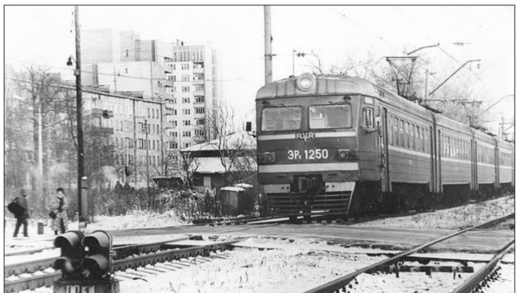
Электропоезд отбывает от платформы Татьянано. 1995 год.