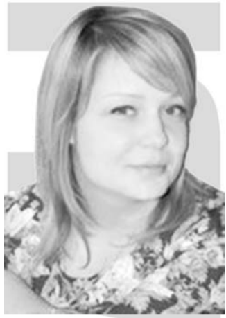
Менеджер по продажам.

Вопрос следующего номера: «Наступает последний весенний месяц, скоро — лето! А Вы готовитесь к пляжному сезону?» *