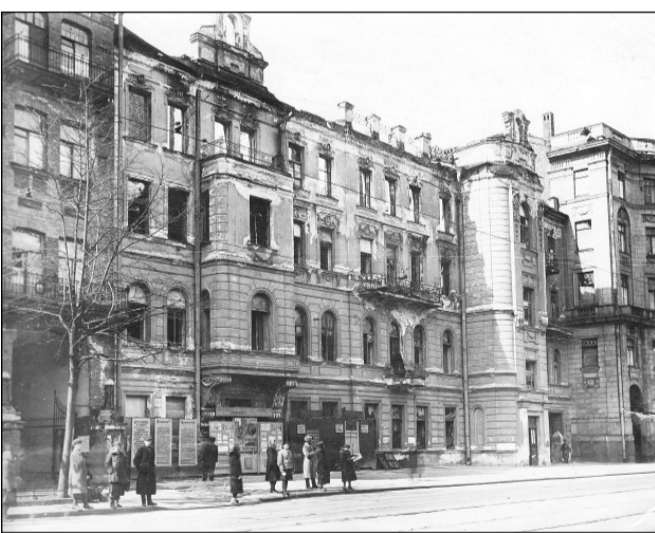
Кировский пр., д. 24-а, главный фасад. 20 апреля 1944 г.