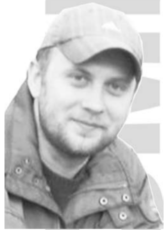
Ковровых дел мастер, специалист по ворсу.

Сейчас Россия выздоравливает! Я в это свято верю, я это вижу и чувствую.