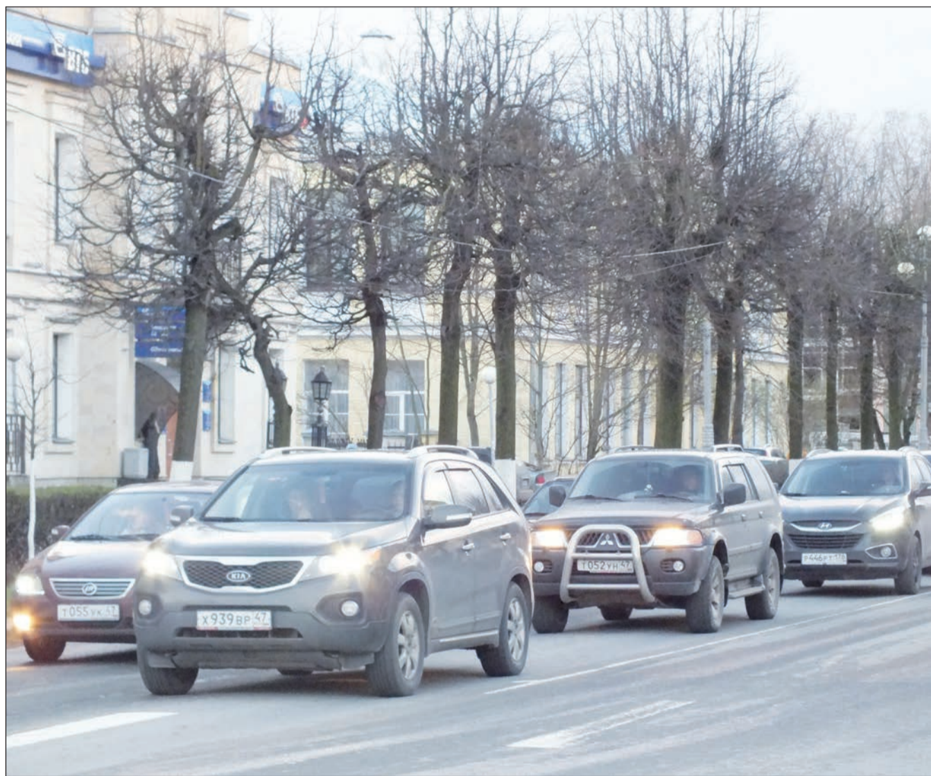
Материал читайте на 4-й странице.