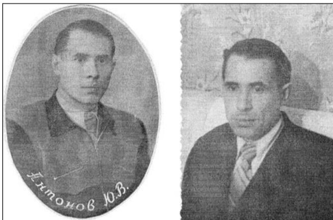
Фото до войны и после.